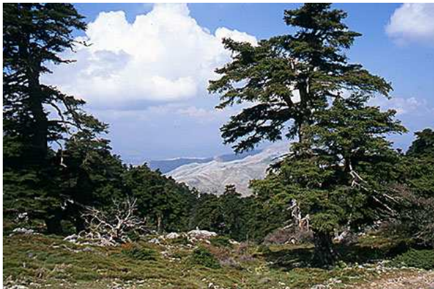
Sierra de Las Nieves