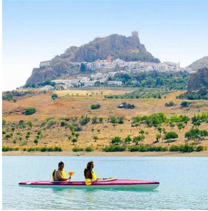
Piragua en el embalse de Zahara